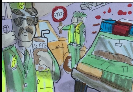
AGENTES ENFERMOS EN LA RIOJA. UN MANDO DE ÉLITE DE LA GUARDIA CIVIL QUE CONFINÓ UN BARRIO DE HARO INGRESA GRAVE EN LA UCI