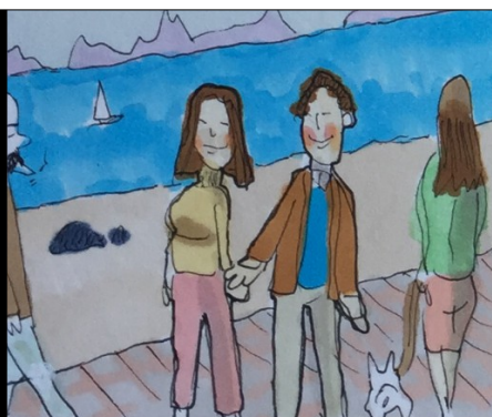
PASEOS. A PESAR DEL DECRETO, MUCHA GENTE PASEA COMO SI NADA