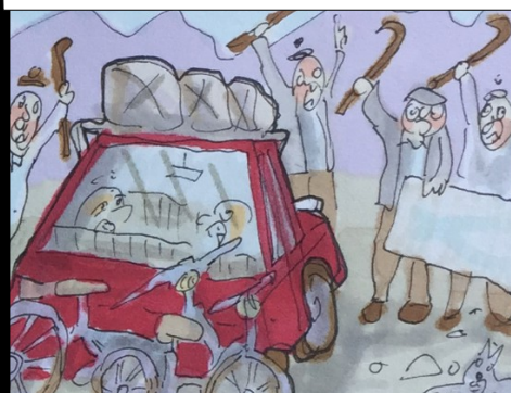
INTRUSOS. EN ALGUNOS PUEBLOS IMPIDEN LA ENTRADA A FORASTEROS,