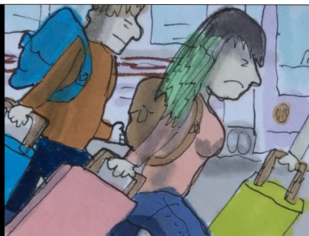
EN TREN Y BUS. ÉXODO DE MILES DE ESTUDIANTES DESDE MADRID QUE REGRESAN CONTAGIADOS AL HOGAR