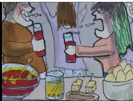
MADRID. FIESTAS DE DESPEDIDAS DE LOS UNIVERSITARIOS, SIN CLASES, ANTES DE VOLVER A CASA.