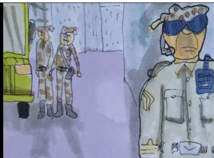
CALLES VACÍAS. SOLO LOS "JEEPS" PATRULLAN POR LAS CIUDADES. LA POBLACIÓN YA ESTÁ CONFINADA