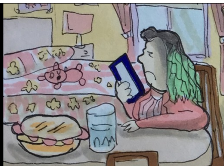
CUARENTENA. MUCHOS ALUMNOS PASAN DÍAS ENCERRADOS EN SUS HABITACIONES PARA NO CONTAGIAR