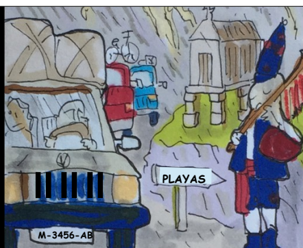
FUGA AL RURAL. ESCAPADA MASIVA A LAS SEGUNDAS RESIDENCIAS